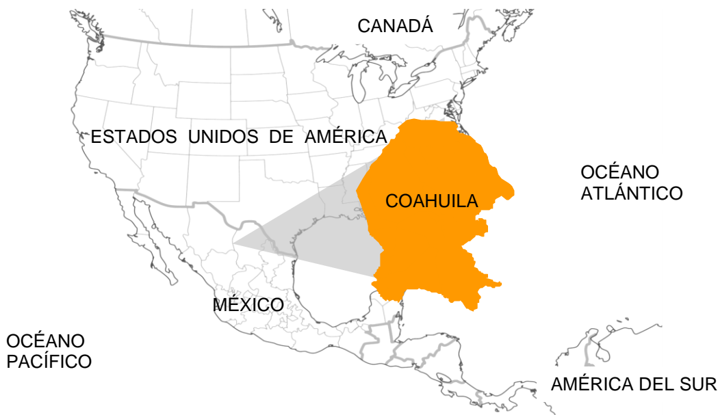
Ubicación de Coahuila de Zaragoza en Norteamérica.

Coahuila de Zaragoza es el tercer estado más grande del país, se encuentra localizado en el Noreste de México y comparte una frontera de 512 kilómetros con el estado norteamericano de Texas. En México, colinda con los estados de Chihuahua, Durango, Zacatecas, San Luis Potosí y Nuevo León.