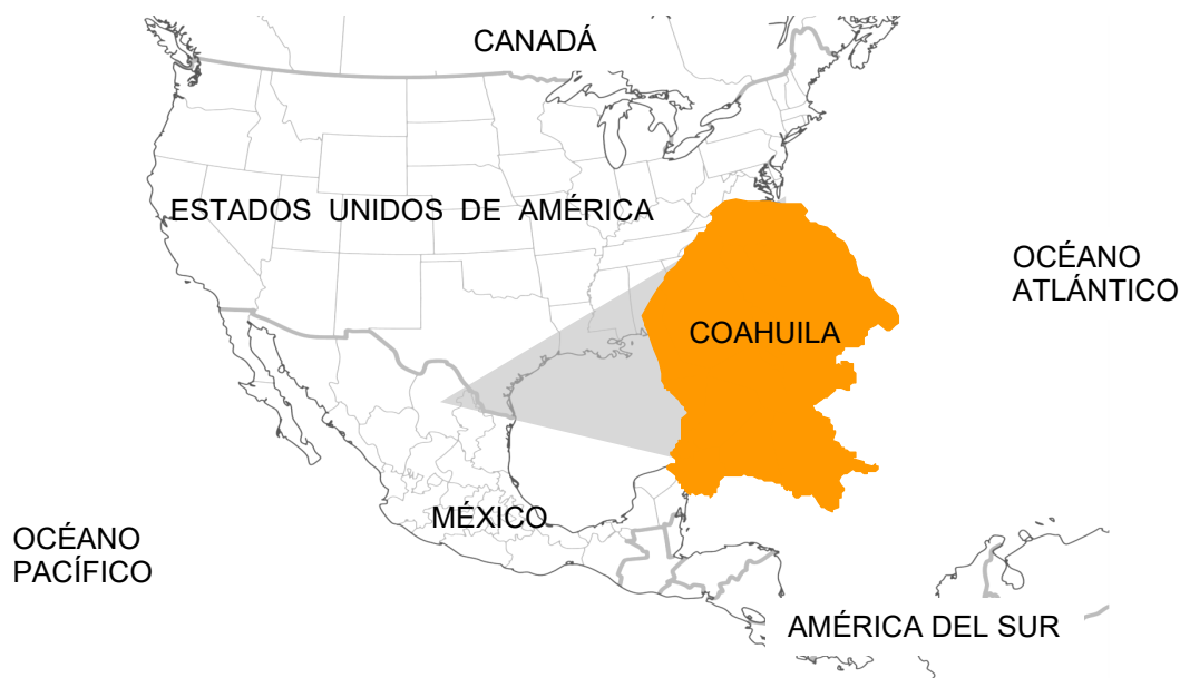
Ubicación de Coahuila de Zaragoza en Norteamérica.

Coahuila de Zaragoza es el tercer estado más grande del país, se encuentra localizado en el Noreste de México y comparte una frontera de 512 kilómetros con el estado norteamericano de Texas. En México, colinda con los estados de Chihuahua, Durango, Zacatecas, San Luis Potosí y Nuevo León.