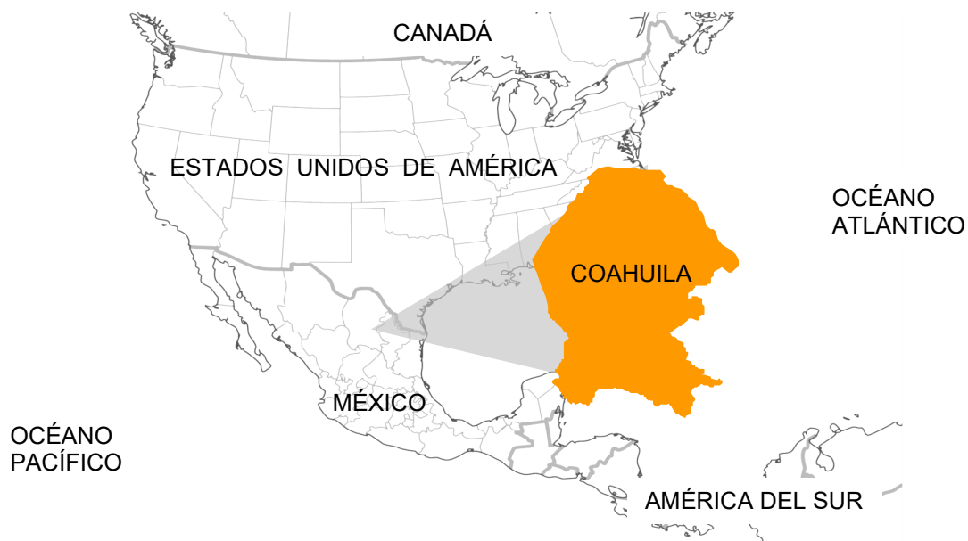
Ubicación de Coahuila de Zaragoza en Norteamérica.

Coahuila de Zaragoza es el tercer estado más grande del país, se encuentra localizado en el Noreste de México y comparte una frontera de 512 kilómetros con el estado norteamericano de Texas. En México, colinda con los estados de Chihuahua, Durango, Zacatecas, San Luis Potosí y Nuevo León.