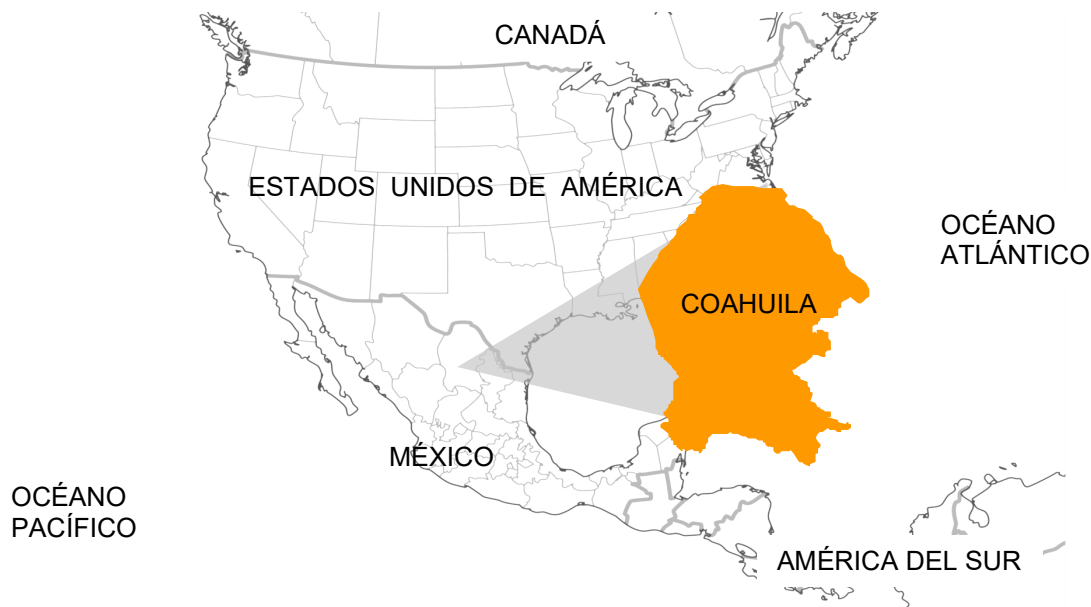
Mapa 1. Ubicación de Coahuila de Zaragoza en Norteamérica.

Coahuila de Zaragoza es el tercer estado más grande del país, se encuentra localizado en el Noreste de México y comparte una frontera de 512 kilómetros con el estado norteamericano de Texas. En México, colinda con los estados de Chihuahua, Durango, Zacatecas, San Luis Potosí y Nuevo León.