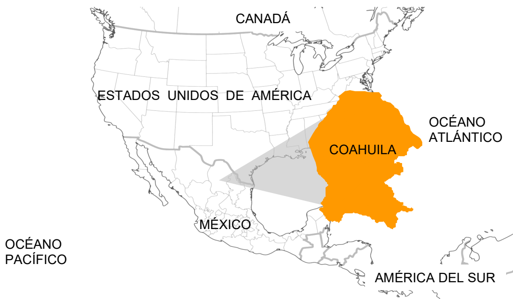
Ubicación de Coahuila de Zaragoza en Norteamérica.

Coahuila de Zaragoza es el tercer estado más grande del país, se encuentra localizado en el Noreste de México y comparte una frontera de 512 kilómetros con el estado norteamericano de Texas. En México, colinda con los estados de Chihuahua, Durango, Zacatecas, San Luis Potosí y Nuevo León.