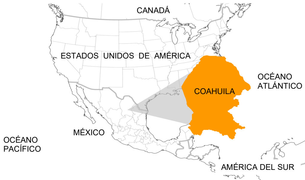
Ubicación de Coahuila de Zaragoza en Norteamérica.

Coahuila de Zaragoza es el tercer estado más grande del país, se encuentra localizado en el Noreste de México y comparte una frontera de 512 kilómetros con el estado norteamericano de Texas. En México, colinda con los estados de Chihuahua, Durango, Zacatecas, San Luis Potosí y Nuevo León.